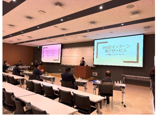
会場（札幌学院大学新札幌キャンパス）の様子②