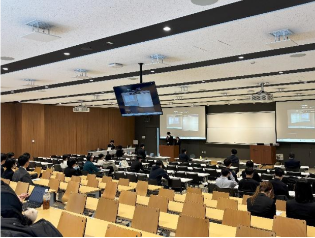
会場（札幌学院大学新札幌キャンパス）の様子①