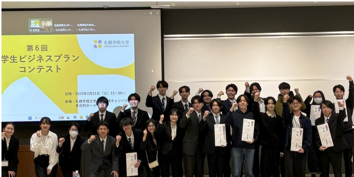
出場者の皆さんでの記念撮影