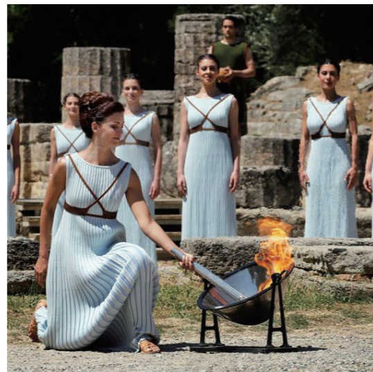
オリュピアのヘラ神殿での聖火採火式