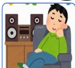
静かな音楽を聴く