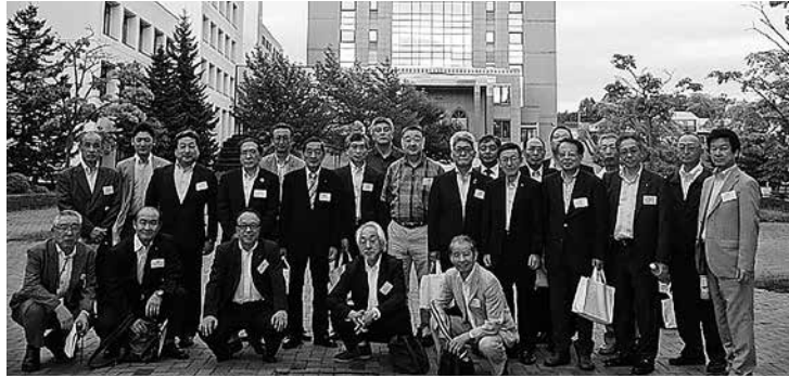
各支部代表の皆様です。

第22回支部長会議が平成28年8月26日(金)午後2時から本学第一キャンパス、第二キャンパスにて開催されました。