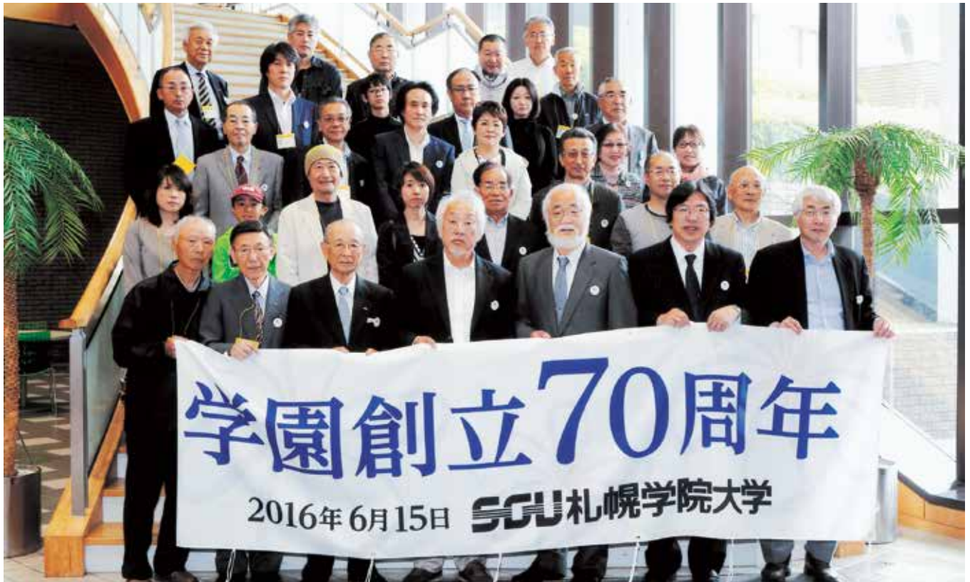
学園創立70周年記念「ホームカミングデー」

札幌文科専門学院・札幌短期大学・札幌商科大学・札幌学院大学同窓会 http://www.sgu.ac.jp/bunsen1/