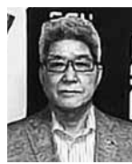
會慶一介氏 (短大16期I商) (株)ソケイズ